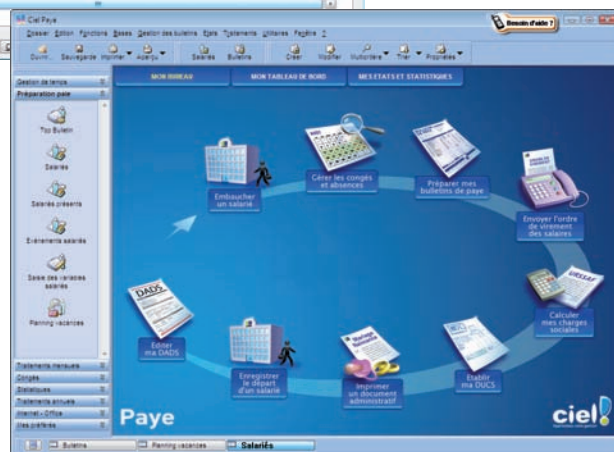
↑ Suivez le guide ! INTUICIEL® vous propose les principales étapes du cycle de gestion de votre entreprise.